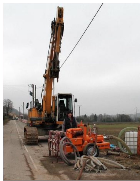
La présence d'engins sur la voie et les importants travaux ont nécessité une déviation jusqu'à fin mars.

L'entreprise reviendra ensuite afin de reprendre l'ensemble des branchements des particuliers situés le long de cette nouvelle colonne. Une mise en eau définitive de cette dernière devrait avoir lieu d'ici juin.